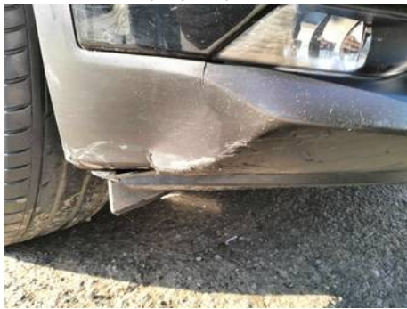
Bouclier avant (Impact)